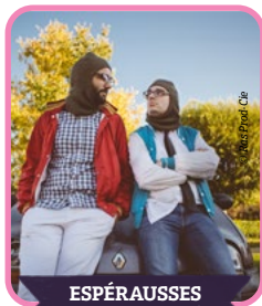
ESPÉRAUSSES PARVIS SALLE DES FÊTES