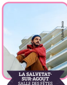
LA SALVETAT- SUR-AGOUT SALLE DES FÊTES

Le Schmilblick Club transforme la place en piste de danse avec son manège musical participatif. Le public est invité à bouger et à jouer. Un moment ludique, accessible à tous, pour une expérience collective et joyeuse.