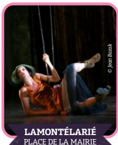
LAMONTÉLARIÉ PLACE DE LA MAIRIE

Deux frères partent pour un voyage... de quelques mètres. Entre jeux et souvenirs, ils embarquent le public dans un univers sans parole mêlant humour visuel et théâtre gestuel. Un moment tendre, accessible dès 8 ans. Goûter proposé par l'association L'Envolée.