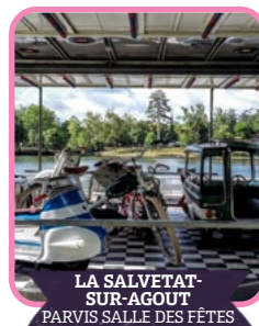
LA SALVETAT- SUR-AGOUT PARVIS SALLE DES FÊTES

À La Salvetat-sur-Agout, la restauration fait partie du rendez-vous. La Diane au Gros Gibier propose un repas simple et convivial, ancré dans le territoire. Un moment pour partager et prolonger le festival. Bar proposé par l'Amicale des Pompiers.