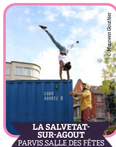
LA SALVETAT- SUR-AGOUT PARVIS SALLE DES FÊTES

Ce spectacle mêle humour, poésie et réflexion. À travers un personnage sensible, il aborde des sujets de société avec des jeux de langage. Une mise en scène simple laisse toute la place aux mots. Un moment à la fois accessible et profond.