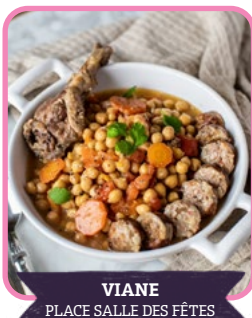
VIANE PLACE SALLE DES FÊTES

La Clique propose un spectacle improvisé et interactif. À partir des idées du public, les artistes créent des scènes uniques. Chaque représentation est différente. Un moment participatif, drôle et accessible à tous.