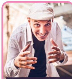
LACAUNE PLACE DE L'ÉGLISE

La Fanfare des Goulamas débarque au festival Marée Haute avec son énergie communicative. Composée de 7 musiciens, elle propose un répertoire festif et rythmé. Cuivres, percussions et bonne humeur pour des interventions joyeuses et pleines de surprises.