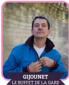
GIJOUNET LE BUFFET DE LA GARE

En partenariat avec Los Passejaires. Réservation conseillée : coordination@arpegesettremolos.net