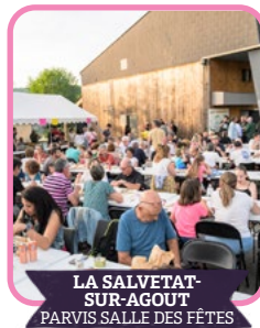
LA SALVETAT- SUR-AGOUT PARVIS SALLE DES FÊTES

Deux hommes se rencontrent autour d'un conteneur. Ils ne parlent pas la même langue mais apprennent à communiquer. Entre rythme, musique et mouvement, leur relation évolue. Un spectacle sur la rencontre et le vivre ensemble.