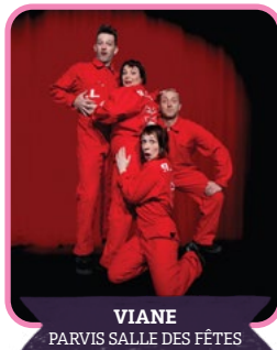
VIANE PARVIS SALLE DES FÊTES